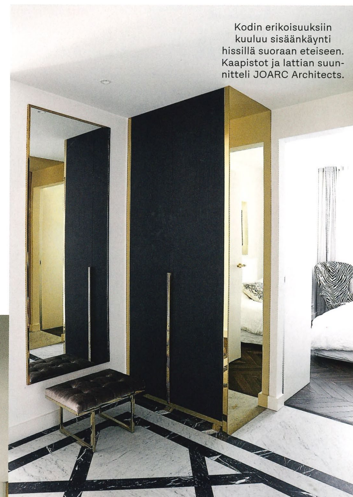
Kodin erikoisuuksiin kuuluu sisäänkäynti hissillä suoraan eteiseen. Kaapistot ja lattian suunnitteli JOARC Architects.

Ala-aulasta kuljetaan hissillä suoraan kodin eteiseen.