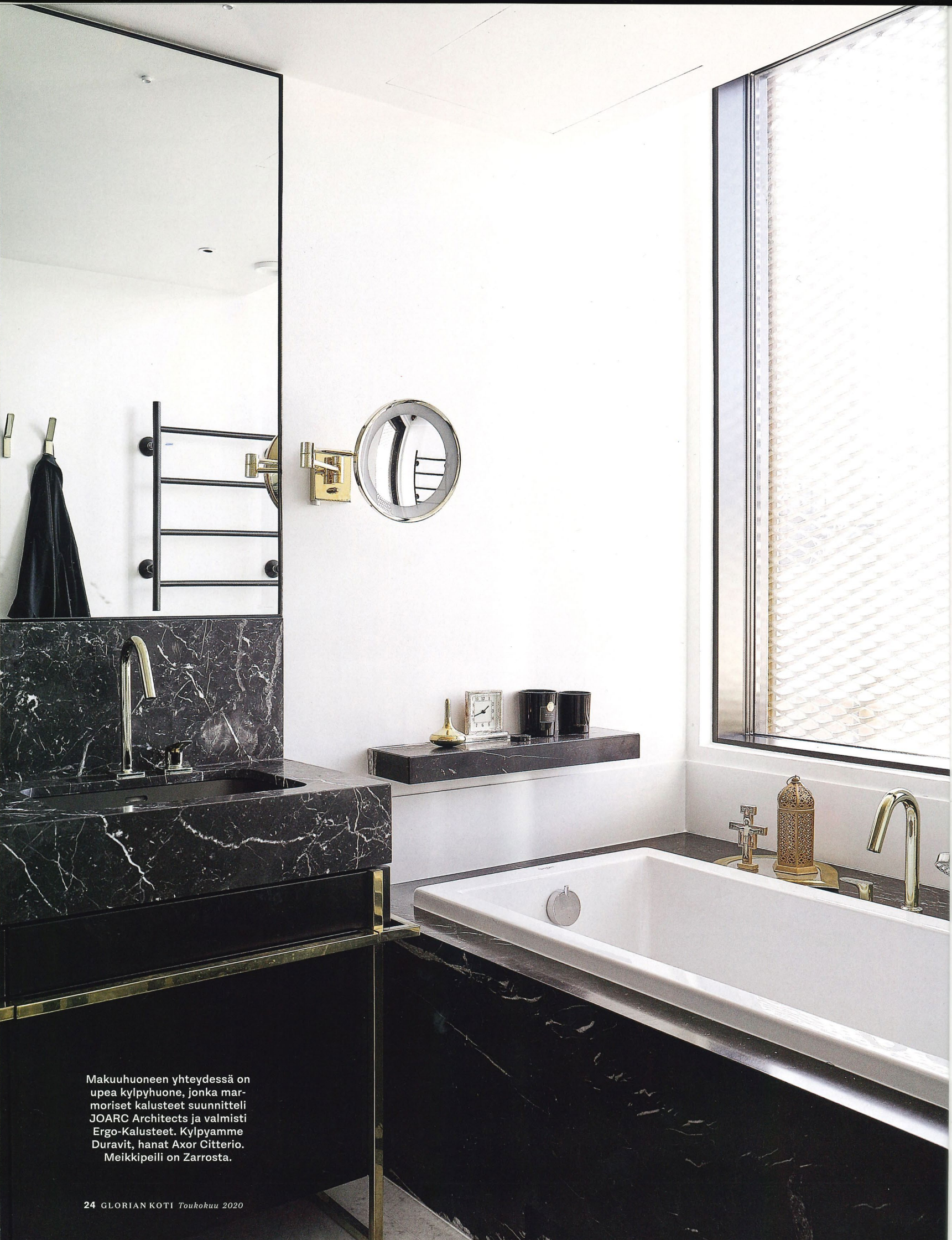
Makuuhuoneen yhteydessä on upea kylpyhuone, jonka marmoriset kalusteet suunnitteli JOARC Architects ja valmisti Ergo-Kalusteet. Kylpyamme Duravit, hanat Axor Citterio. Meikkipeili on Zarrosta.

Ala-aulasta kuljetaan hissillä suoraan kodin eteiseen.