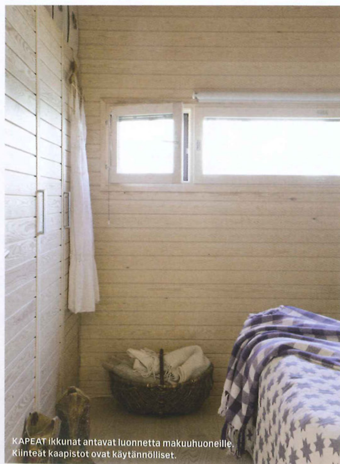
KAPEAT ikkunat antavat luonnetta makuuhuoneille. Kiinteät kaapistot ovat käytännölliset.