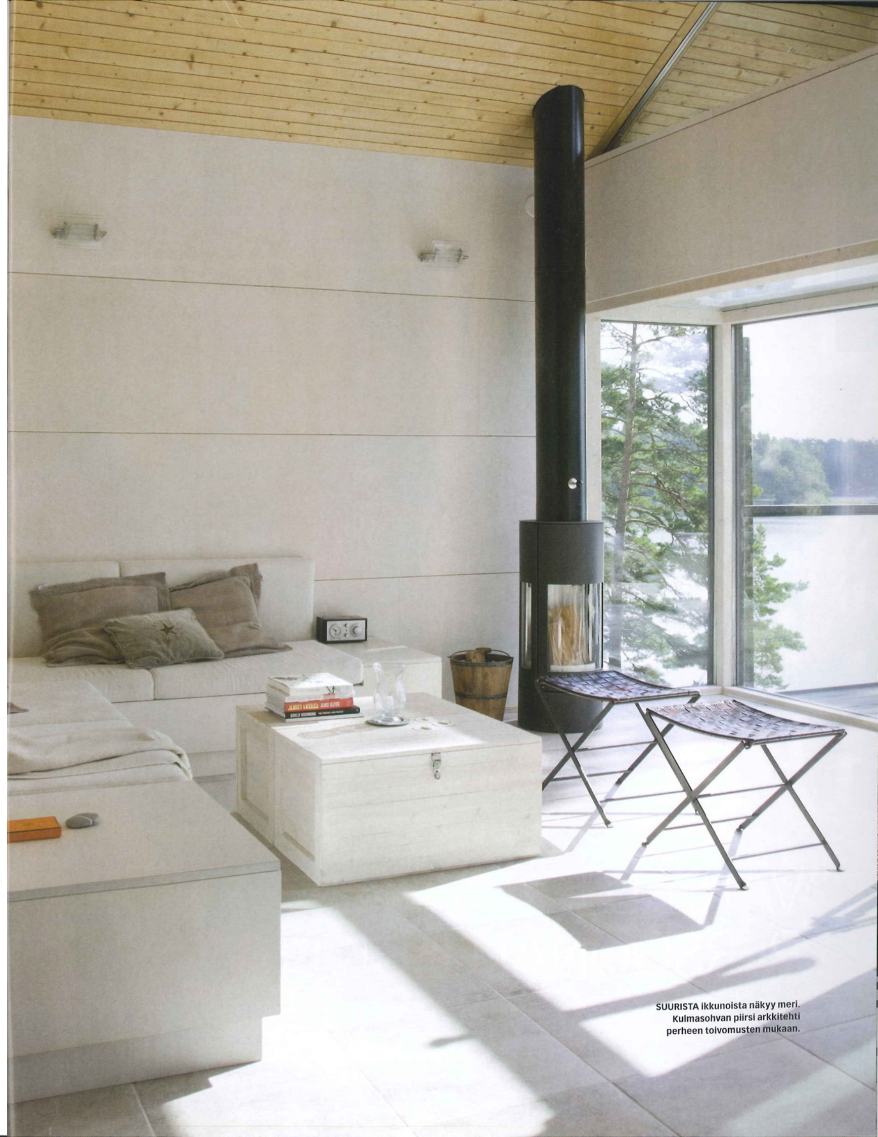
SUURISTA ikkunoista näkyy meri. Kulmasohvan piirsi arkkitehti perheen toivomusten mukaan.