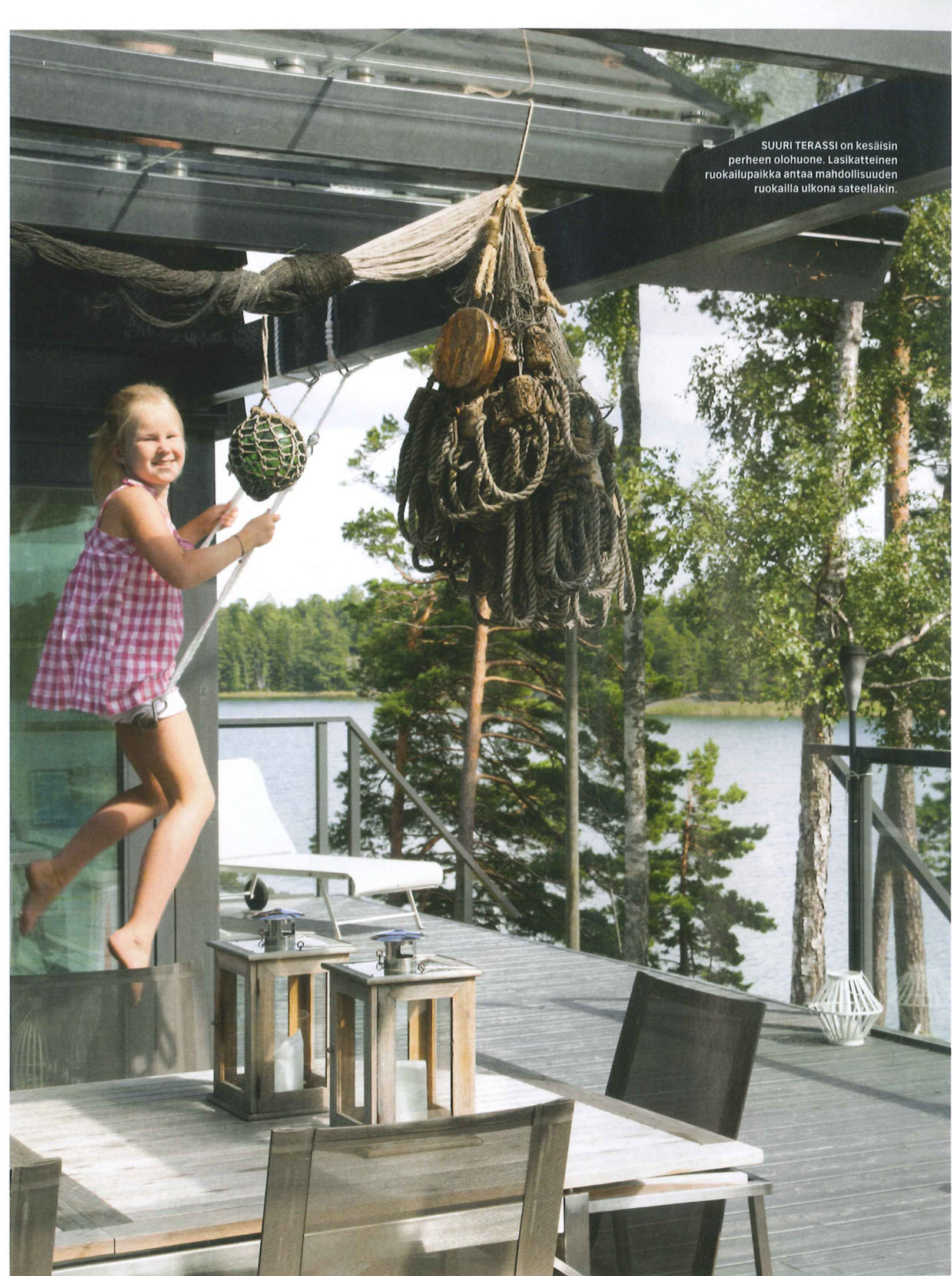
SUURI TERASSI on kesäisin perheen olohuone. Lasikattuinen ruokailupaikka antaa mahdollisuuden ruokailla ulkona sateellakin.