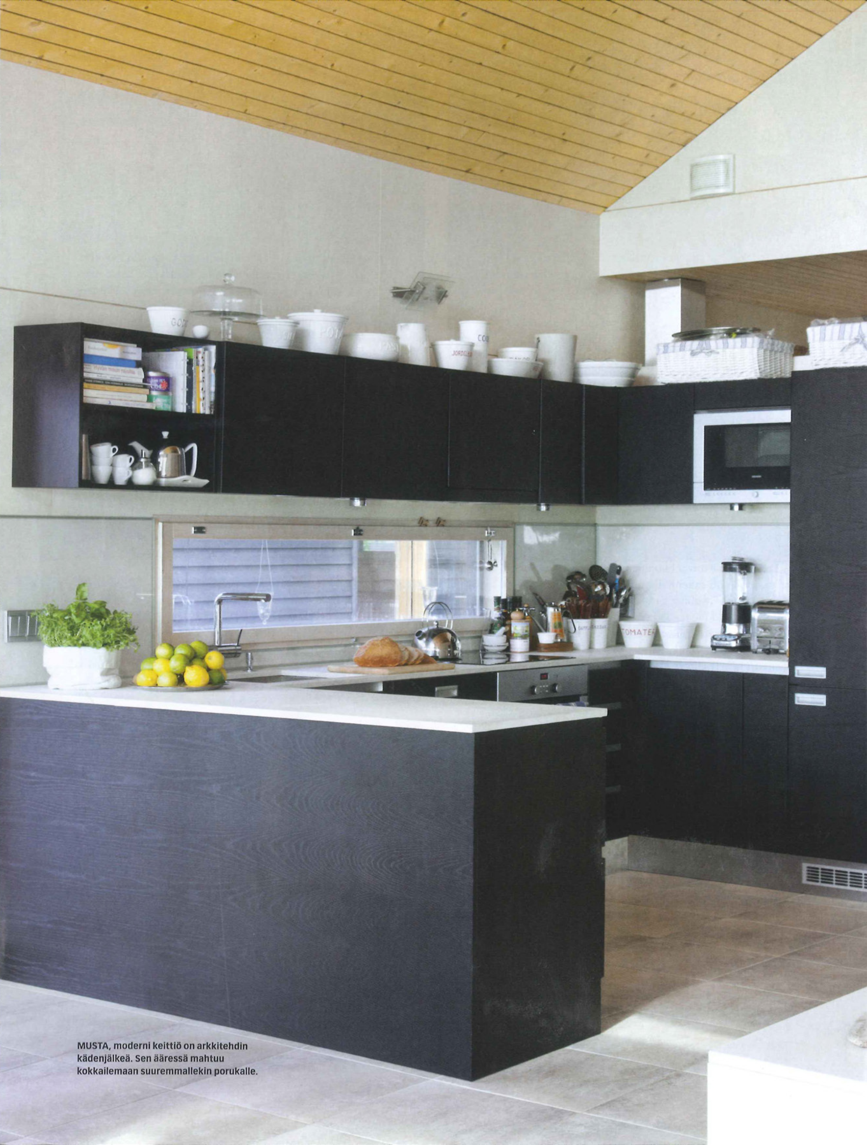
MUSTA, moderni keittiö on arkkitehdin kädenjälkeä. Sen ääressä mahtuu kokkailemaan suuremmallekin porukalle.