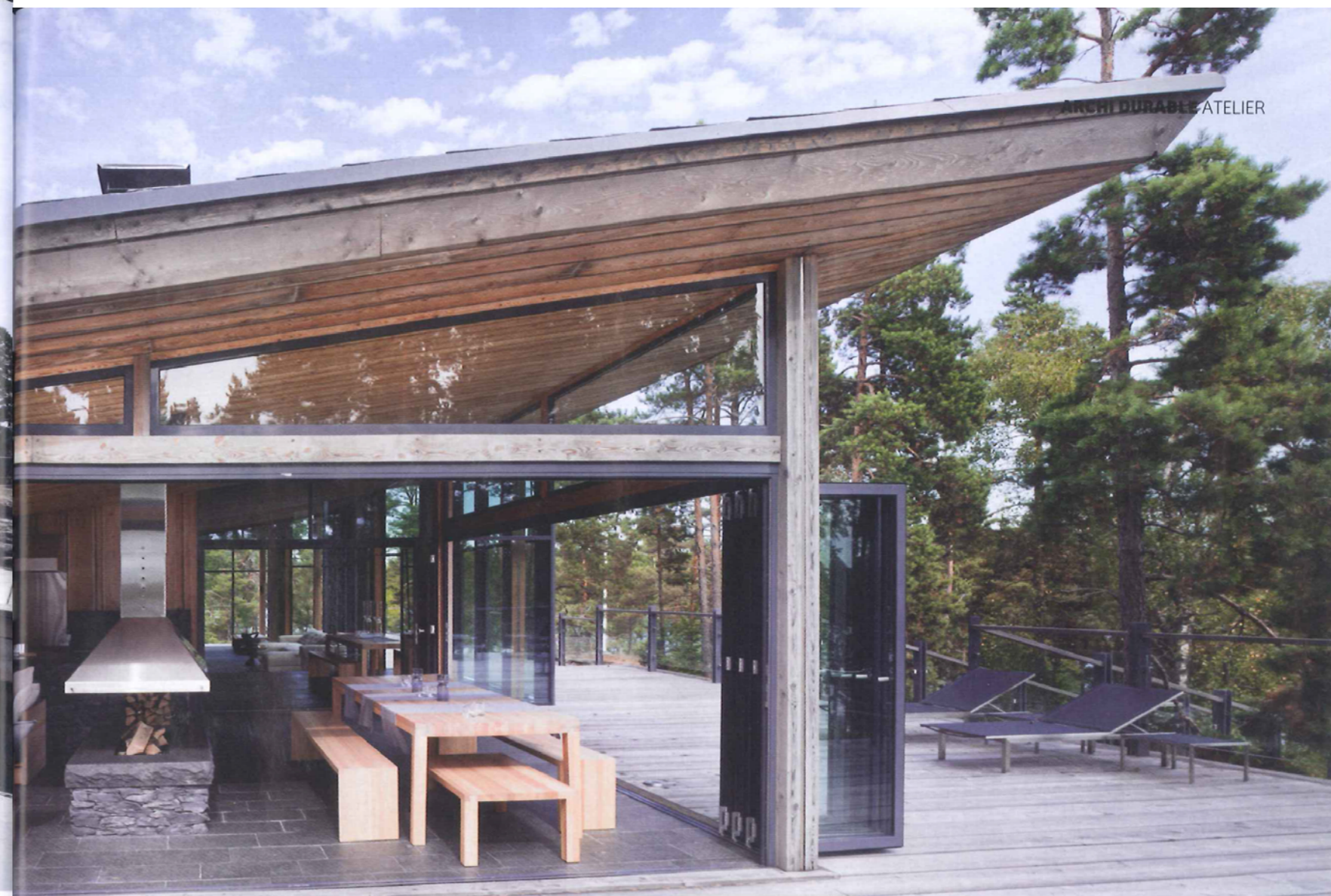
La maison est essentiellement habillée de deux matériaux : le mélèze sibérien, que l'on retrouve aussi bien en façade et sur le toit qu'à l'intérieur, mais aussi une pierre sombre et naturelle utilisée ponctuellement à l'intérieur comme à l'extérieur, notamment pour tapisser le bassin de la piscine.