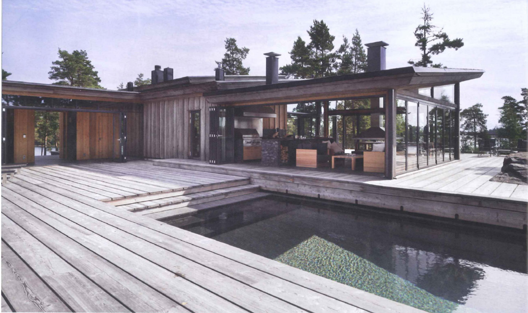
La villa Korsholmen se situe sur une île de l'archipel finlandais, perchée sur la péninsule ouest. Une exposition qui permet à cette luxueuse propriété de profiter de la lumière toute la journée dans ce coin de l'archipel où le soleil ne se couche jamais durant plusieurs semaines d'été.